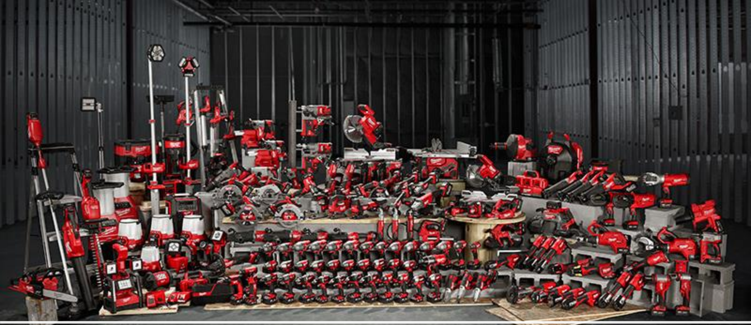
Dụng cụ dùng pin 18V